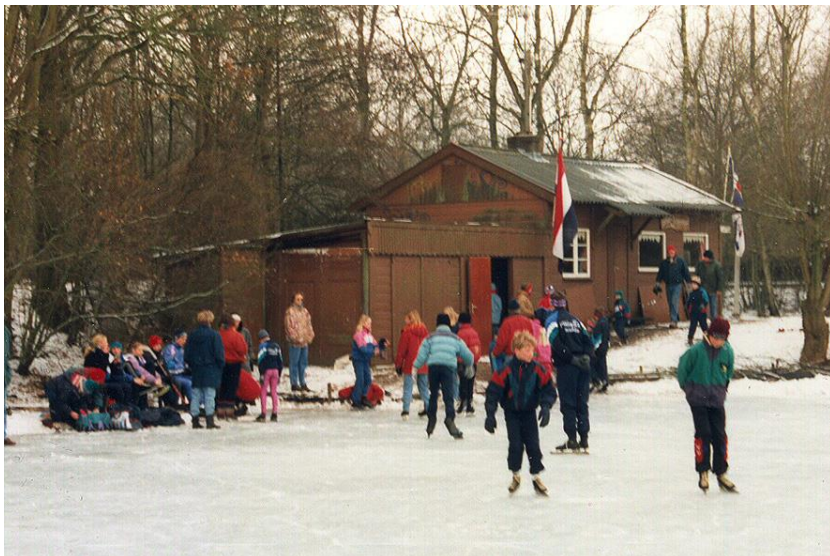
Winter 1995/1996. Het ijsclubgebouw bij de "oude" ijsbaan. In juli 1996 is die ijsbaan gedempt en het ijsclubgebouw afgebroken ten behoeve van de aanleg van de nieuwe Rijksweg (A32).

Bij de recente herziening van het bestemmingsplan Oranjewoud-dorp is op initiatief van de IJclub in het bestemmingsplan de mogelijkheid opgenomen om bij de ijsbaan een ijsclubgebouw te realiseren. De financiële en technische mogelijkheden om een dergelijk gebouwtje daadwerkelijk te kunnen realiseren worden momenteel onderzocht.